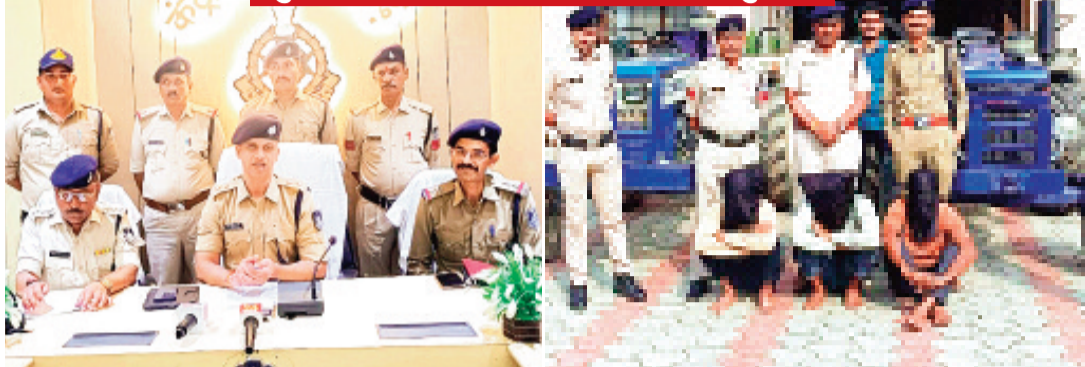
हरिभूमि न्यूज़ ▶▶ ब्यावरा

पुलिस अधीक्षक ने प्रेस कॉन्फ्रेंस में किया खुलासा