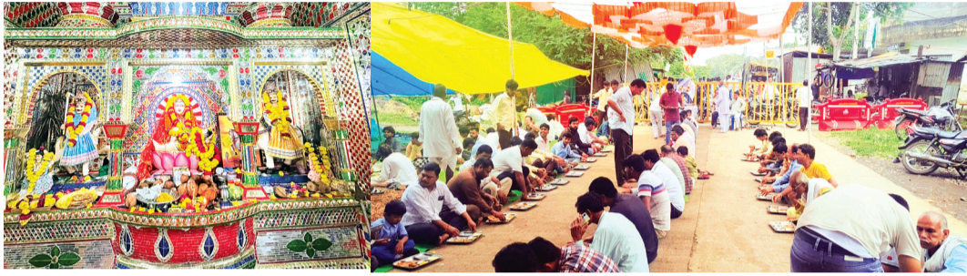
डोकरपुरा में स्थित श्री देवनारायण मंदिर पर दोपहर 12 बजे झंडा चढाकर महाआरती

लोकदेवता भगवान श्री देवनारायण का 1114 जन्मोत्सव भाद्रपद छठ शुकवार को नगर व ग्रामीण अंचल में हर्षोल्लास के साथ मनाया गया। भगवान श्री देवनारायण के जन्मोत्सव पर मंदिरों में पुष्प एवं विद्युत साज सजा की गई। सुबह से ही मंदिरों में भजन पूजन की प्रक्रिया प्रारंभ हुई। भगवान श्री देवनारायण को दूध से स्नान कराने के बाद अलौकिक श्रृंगार भी किया गया। क्षेत्र के ग्राम कचनारिया में स्थित राडी वाले देवनारायण मंदिर नलखेड़ा में डोकरपुरा स्थित देवनारायण मंदिर ग्राम गोयल में स्थित भगवान श्री देवनारायण एवं देवधाम बल्डी सामरी ग्राम चापाखेड़ा पानखेड़ी दमदम पिलवास गुदरावन आदि में स्थित देवनारायण मंदिर एवं क्षेत्र के सभी देवनारायण मंदिर में भजन पूजन के साथ चल समारोह के कार्यक्रम आयोजित किए गए। दोपहर 12 बजे भगवान श्री देवनारायण की महा आरती की गई। इसके पश्चात भोजन प्रसादी का वितरण किया गया। नगर के