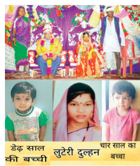
डेढ़ साल की बच्ची लुटेरी दुल्हन बरार साल का बच्चा