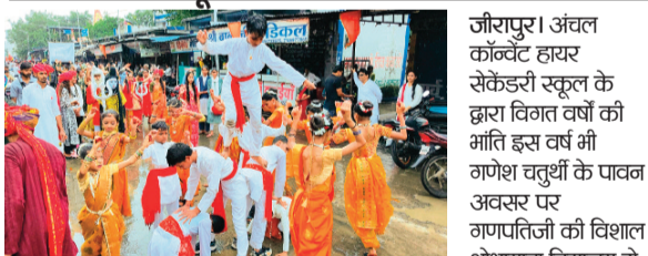
हरिभूमि न्यूज़ ▶▶ राजगढ़

जौरापुर। अंचल कान्वेंट हायर सेकेंडरी स्कूल के द्वारा विगत वर्षों की भांति इस वर्ष भी गणेश चतुर्थी के पावन अवसर पर गणपतिजी की विशाल शोभायात्रा विद्यालय से प्रारंभ की गई। जौ नगर के विभिन्न मार्गों से होती हुई बुधवारिया बाजार, इंदर चौराहा, बस स्टैंड पहुंची मध्य रास्ते में विद्यालय के नवह मुग्गे छात्र-छात्राओं सहित समस्त विद्यार्थियों ने आकर्षक वेशभूषण में विभिन्न कार्यक्रम नगर के प्रमुख प्रमुख स्थानों पर प्रस्तुत किया। विद्यालय के बालक बालिकाएं मध्य रास्ते में गरबा नृत्य के साथ-साथ नाटक एवं मजनों की प्रस्तुति जिसमें विशेष कर गणेश स्तुति, ऑपरेशन सिंदूर, विद्या एवं कुप्रथा, रानी सती आदि विभिन्न विषयों के जीवन पर आधारित एवं अर्थ नरिंश्वर पर भी अपना शानदार प्रदर्शन दिखाया।