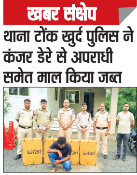
खबर संक्षेप थाना टोंक खुर्द पुलिस ने कंजर डेरे से अपराधी समेत माल किया जब्त