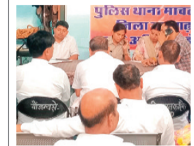
हरिभूमि न्यूज़ ▶▶ मावलपुर

थाना परिसर में गणेश चतुर्थी की पूर्व संध्या मंगलवार शाम को नगर वा क्षेत्र के नागरिकों के साथ शांति समिति की बैठक आयोजित की गई जिसमें आगामी त्योहारों को लेकर सभी विभागों से अपनी अपनी व्यवस्थाओं को चार्ज चैम्बंद करने की बात कही जिसमें बिजली सफाई और सुरक्षा को लेकर सभी ने अपने अपने बात रखी गणेश चतुर्थी पर गणेश स्थापना कर झांकियां बनाने वालों को भी व्यवस्था बनाने को लेकर समझाइश दी गई। साथ ही नगर में विचार करने वाले आवारा पशुओं को भी व्यवस्थित करने की बात उपस्थित लोगों ने की।