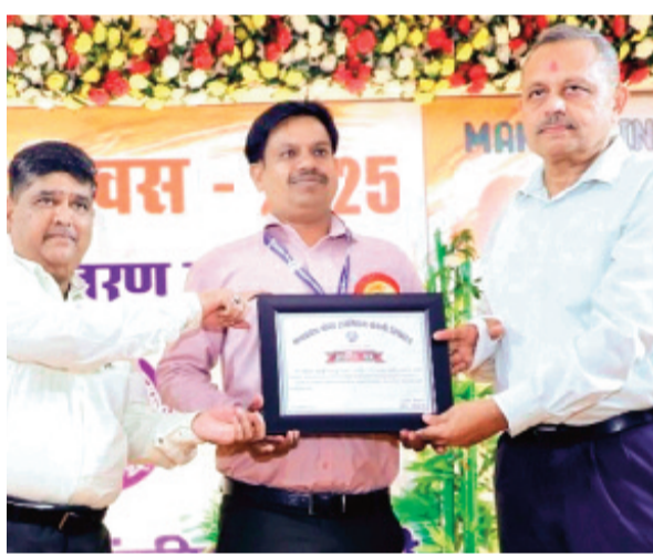
हरिभूमि न्यूज़ ▶▶ राजगढ़